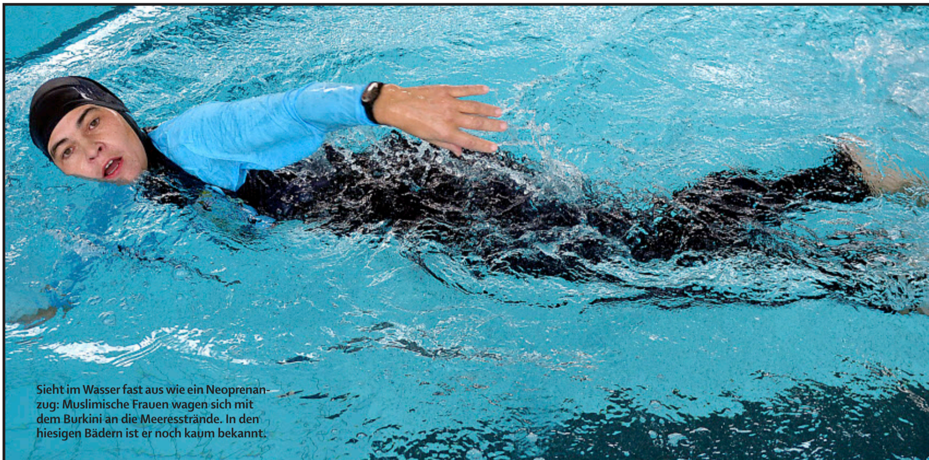
Sieht im Wasser fast aus wie ein Neoprenanzug: Muslimische Frauen wagen sich mit dem Burkini an die Meeresstrände. In den hiesigen Bädern ist er noch kaum bekannt.